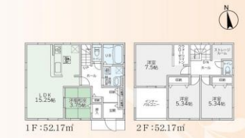
間取り図(2号棟)、価格2499万円、4LDK+S、土地面積177.81㎡、建物面積104.34㎡

2号棟 土地面積 177.81㎡ セットバック面積 4.39㎡ 建物面積 104.34㎡ 建築確認番号/第R05SHC114829号