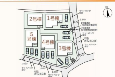
全体区画図 全体区画図

2号棟 土地面積 177.81㎡ セットバック面積 4.39㎡ 建物面積 104.34㎡ 建築確認番号/第R05SHC114829号